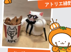
パングルマ手芸部