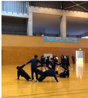
R2.12/15 四国中央市立川之江北中学校 R3.1/22 松山市立北条北中学校、R3.2/9 松山市立浅海小学校

「赤丸急上昇」を講師に招き、小中学生を対象に、自己表現の楽しさや喜びを味わえるワークショップを実施しました。