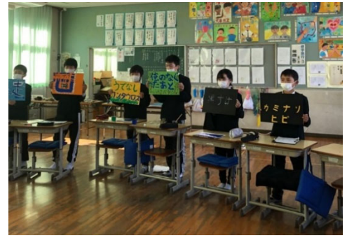
R2.12/18 西予市立大野ヶ原小学校 R2.12/21 四国中央市立関川小学校

学校を探索し、新たな発見をするワークショップを実施しました。「校内にあるもの」の新しい名称を考え、機能やデザインの関係性について話し合うことができました。