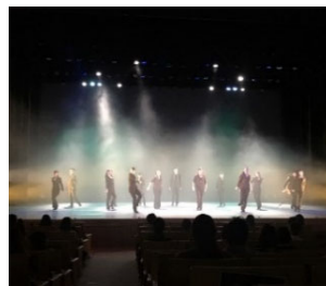
R3.2/7 愛媛県県民文化会館サブホール