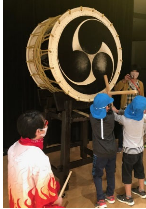
R3.3/10 松山市立認定こども園 中島こども園

離島の子どもたちと一緒に本物の音楽に触れ、「音を楽しむ」コンサートを実施しました。