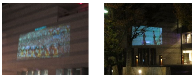
R2.12/5～R3.3/12 愛媛県県民文化会館 壁面