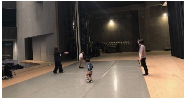
R2.12/19、R3.1/16、2/21 愛媛県県民文化会館メインホール

ダンス、ボディ・ワークセラピーなどジャンルの垣根を越えたワークショップを実施しました。ダンスの専門家を招き、親子でふれあう時間を作ることができました。