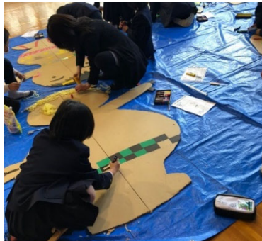
R2.12/2 大洲市立肱川小学校 R2.12/15、R3.3/2 八幡浜市立真穴小学校