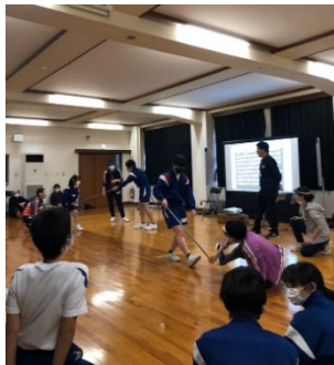
R3.1/13、1/18 愛媛県立松山聾学校

愛媛県在住のヤミーダンスメンバーが、学校に向いて、ダンスワークショップを実施しました。生徒の皆さんとともに身体の解放やコミュニケーション力の向上を図ることができました。