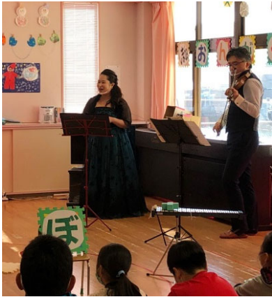
R2.12/11 宇和島市立日振島保育所