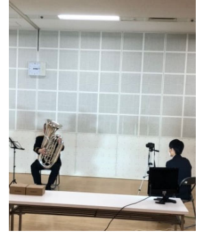
R3.3/3 愛媛県県民文化会館リハーサル室にて

愛媛県警察音楽隊の皆さんにご協力いただき、小学生向け練習動画の撮影を行いました。これは例年開催していた演奏講座が中止となるなか、感染防止対策として実施したものです。撮影した動画をDVDに編集し、希望する小学校に配布することで活用していただきます。