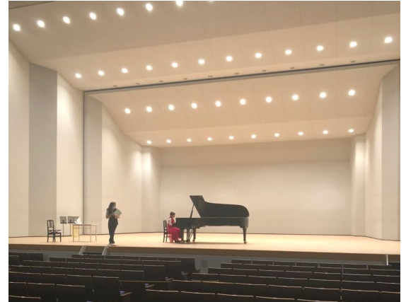
R2.12/12、13 愛媛県県民文化会館メインホール

県内在住の音楽教室で学ぶ未来のアーティストの皆さんに、ホールで練習していただきました。普段練習している音楽教室から飛び出し、ホールならではの音の響きや難しさを体感していただくことができました。